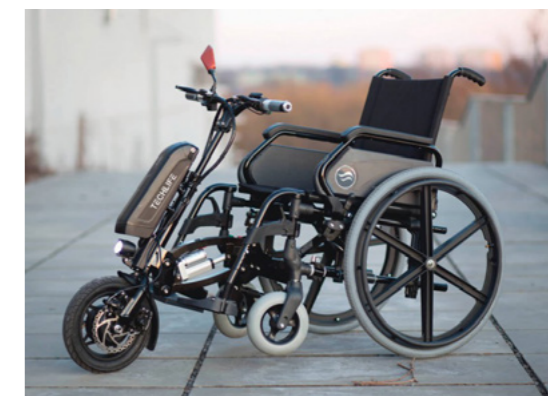
Pohony vhodné pro vozíky s odnímatelnými stupačkami. Například Hurt-e, Techlife W4.